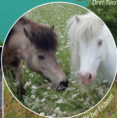
Pferdfe bei Eisborn