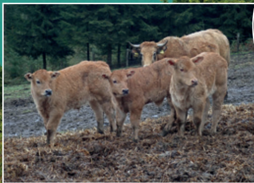
Zum Piener Kopf, Herscheid