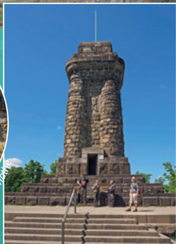
Drei-Türme-Weg bei Hagen