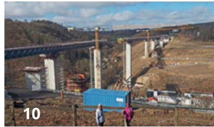
Rückschau | Ausflüge