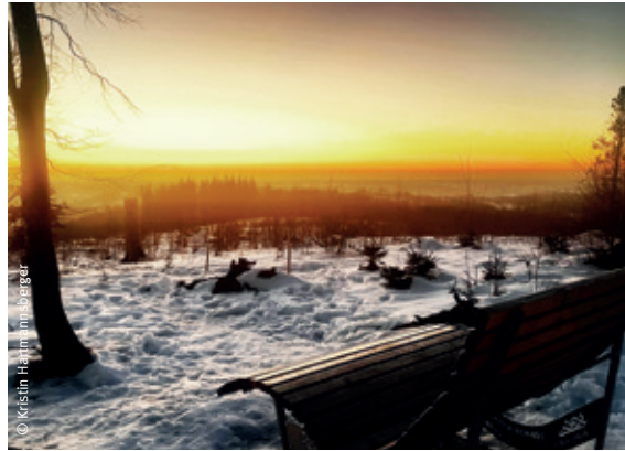
Blick von der Homert Richtung Westen

Jeder, der die Hütte an einem Sonntag besucht hat, konnte