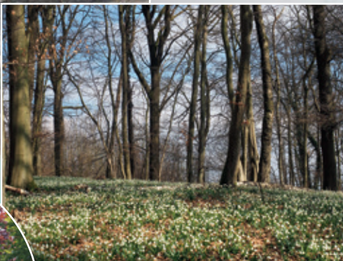
Märzenbecher an der Sorpe