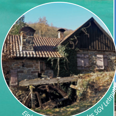
Einkehr im Vereinsheim des SGV Lemdorf